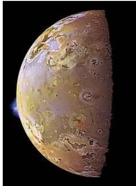
Bild 2 Vulkanismus auf Io 6