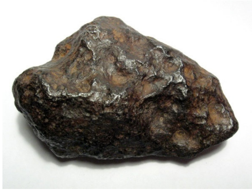
Zdjęcie : Meteoryt żelazny