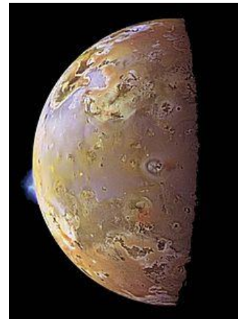
Bild 2 Vulkanismus auf Io https://de.wikipedia.org/wiki/Vulkanismus_auf_dem_Jupitermond_Io